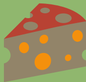
STREEKPRODUCTEN EN BROCANTE WINKEL