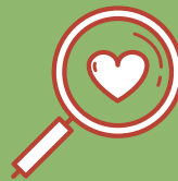
ZATERDAG: SPOREN SPEUREN RONDOM DE BOERDERIJ, JONG EN OUD KUNNEN MEEWANDELEN